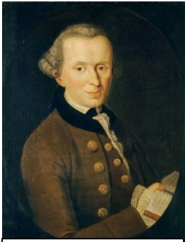
▲ Immanuel Kant 1724 - 1804

So erklärt der Philosoph Immanuel Kant die Menschenwürde: